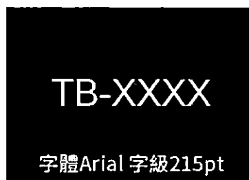
圖示：作品繳交規格